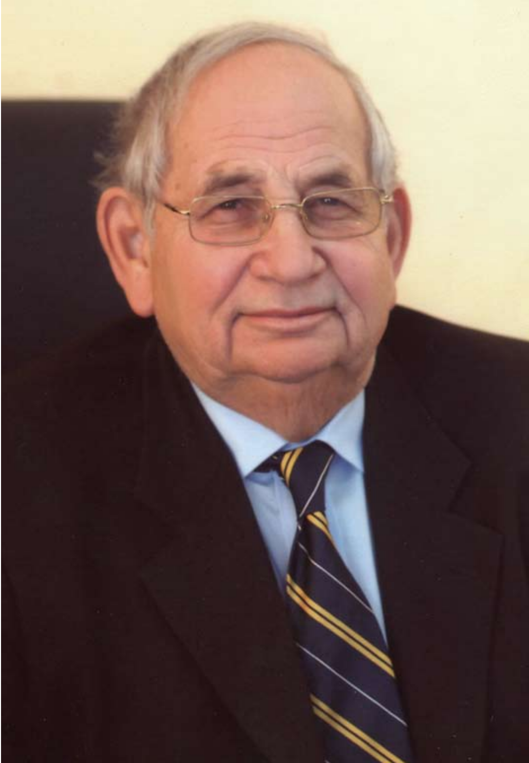
سمو الأمير رعد بن زيد رئيس المجلس الأعلى لشؤون الأشخاص المعوقين